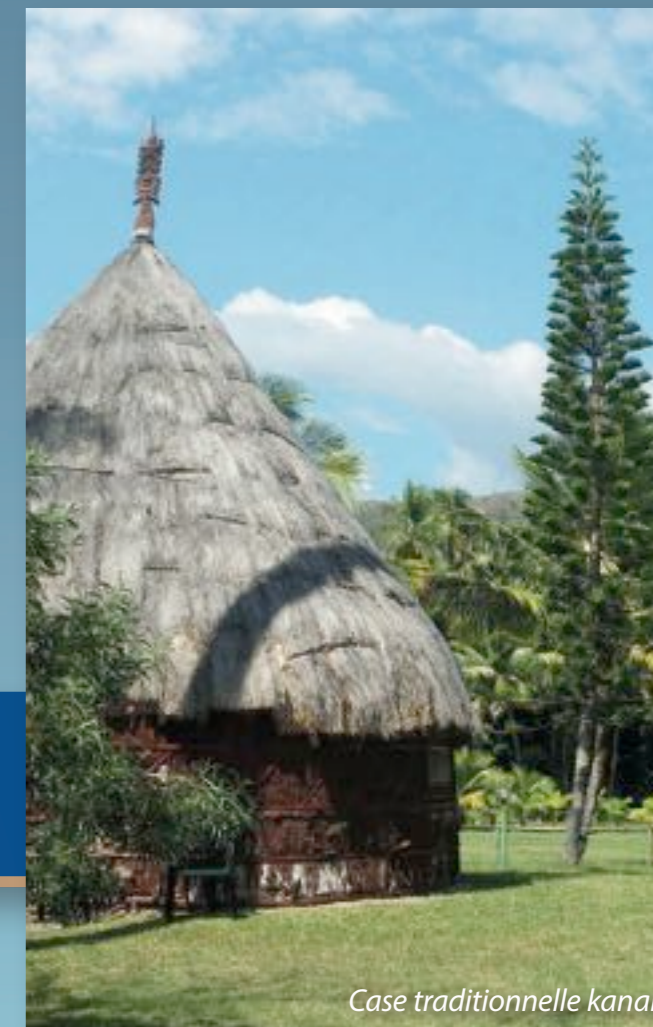
Case traditionnelle kanak