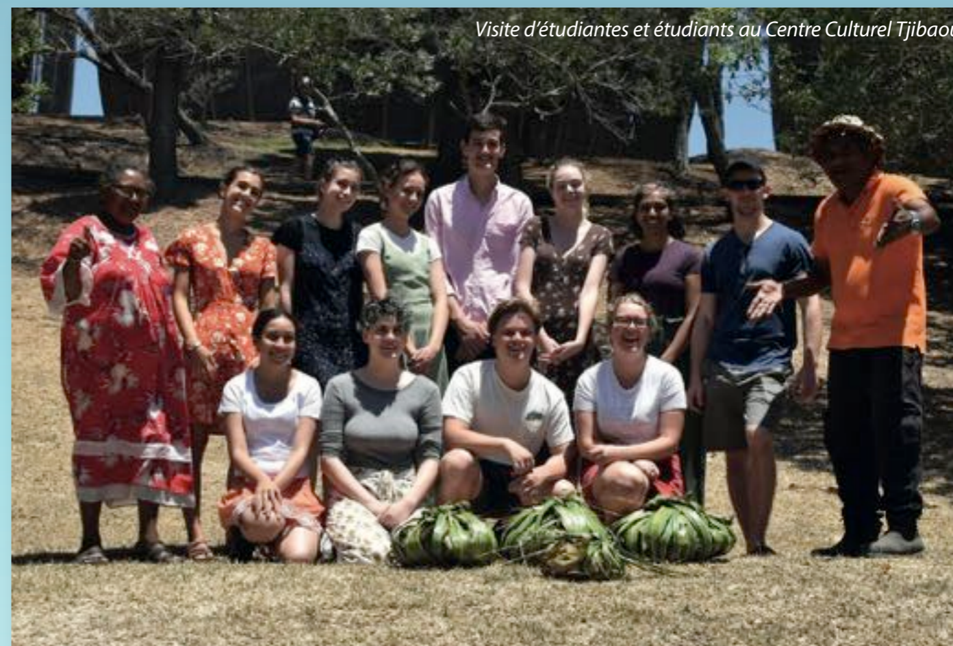
Visite d'étudiantes et étudiants au Centre Culturel Tjibaou