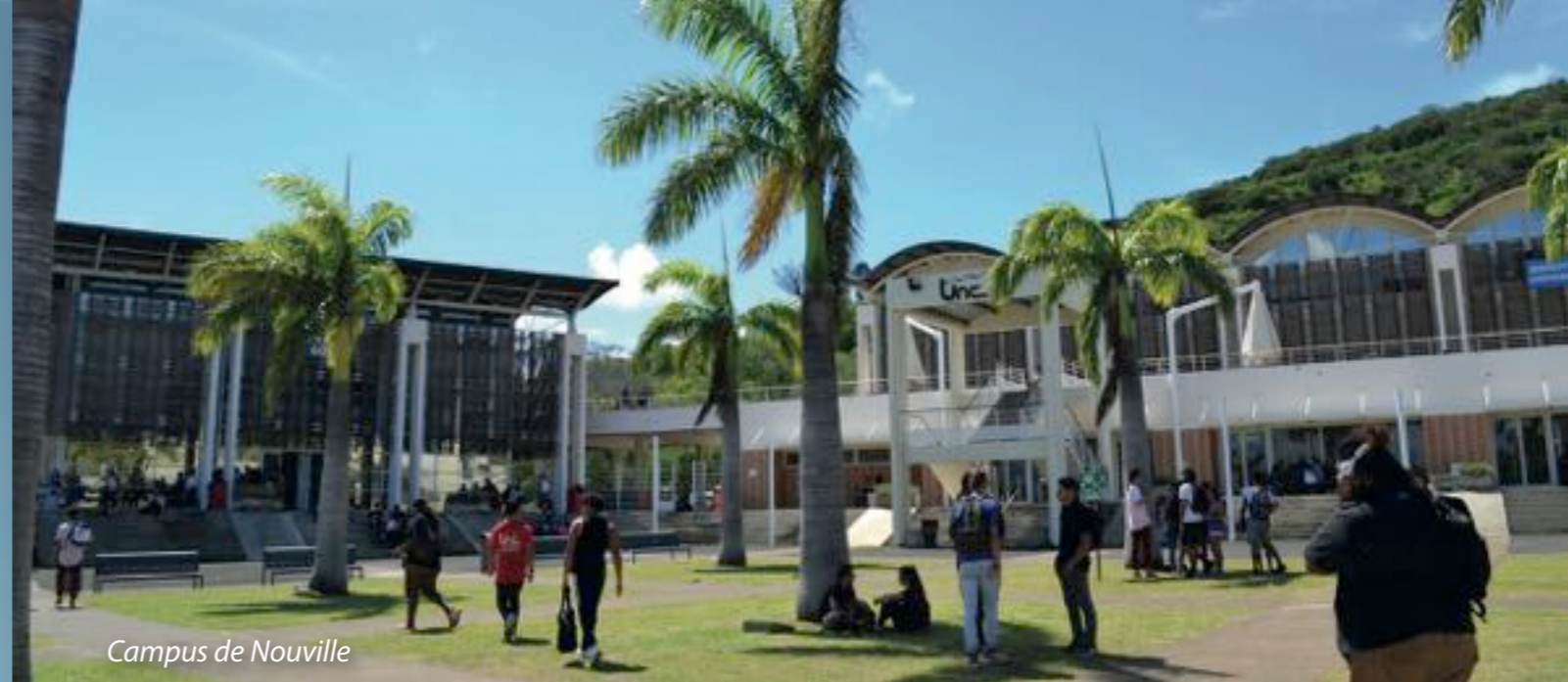
Campus de Nouville